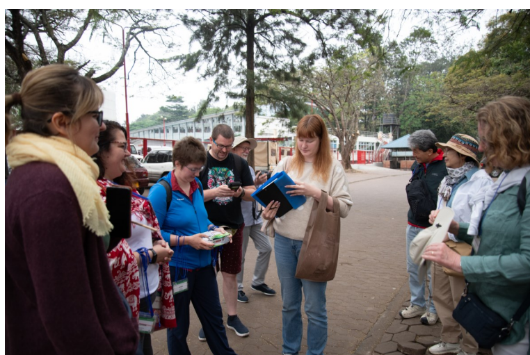
Kongresfak-anoj kun tuj ekskursoj...

Ĝis revido en Brno, Ĉeĥio en la 110-a UK!