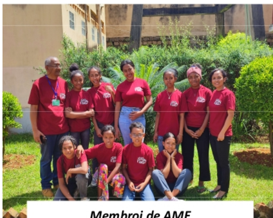
Membroj de AME

La Kristana Seminario-Esperanto okazis de ĵaŭdo la 7a ĝis sabato la 9a de marto 2024 en la gastigejo de la MAMRE FJKM en Sabotsy