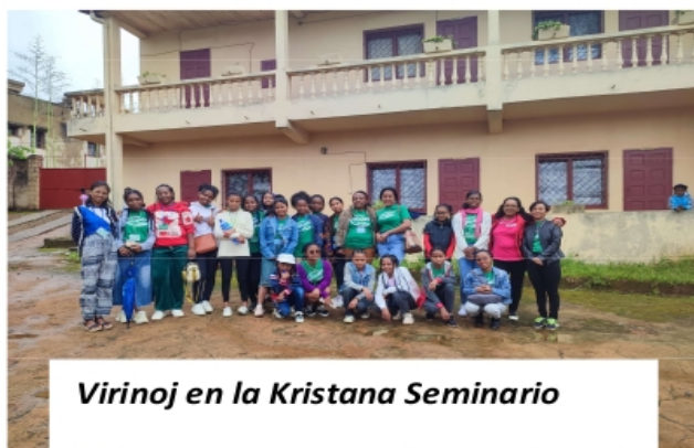
Virinoj en la Kristana Seminario

Ni havis ekskurson en la dua tago. Ni vizitis la praulan kaj reĝan kultejon kaj palacon. Kelkaj homoj, vidinte nin kun la T-ĉemizo, demandis nin pri Esperanto. Eĉ kelkaj neesperantistaj vizitantoj Ĉinio prenis foton kun ni por bona